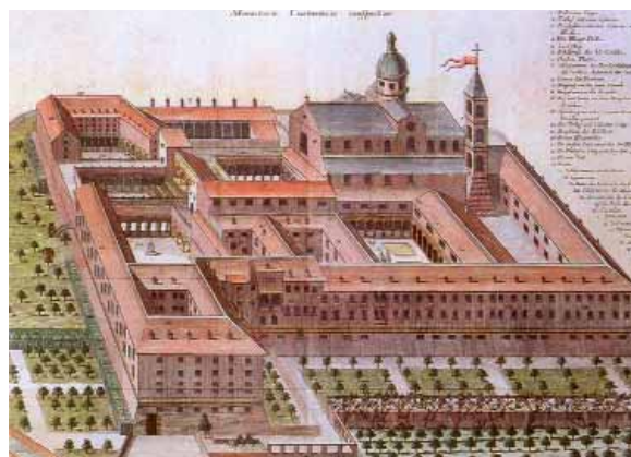
Abbazia di Montecassino (stampa del XVII secolo)